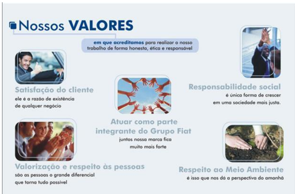
Imagem 9: Valores