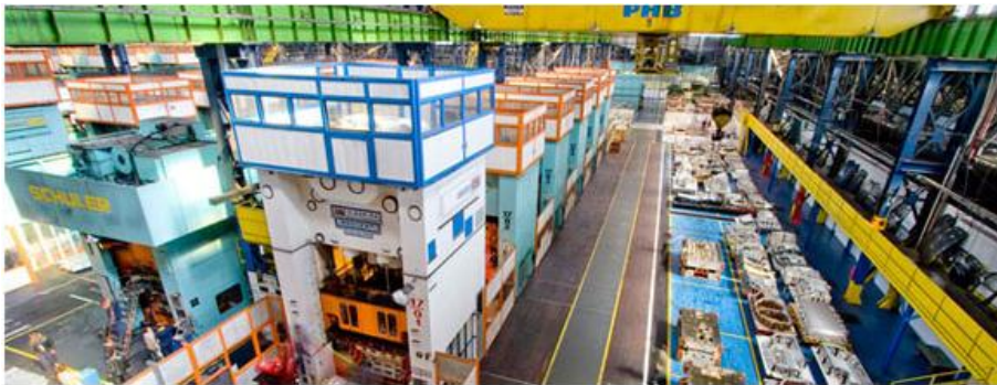
Imagem 5: Prensas

Prensas: no setor de prensas as chapas de aço são transformadas em peças para a carroceria do automóvel. As chapas de aço chegam em bobinas e/ou chapas já cortadas e tratadas quimicamente. As prensas recortam, furam e dobram as chapas até chegar à peça desejada. A figura abaixo representa a linha de prensas robotizada. Todas as aparas de aço não aproveitadas no processo são transformadas em sucatas prensadas e, depois, reprocessadas.