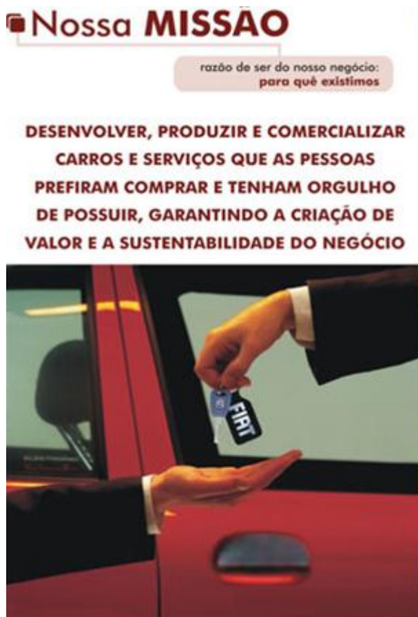
Imagem 8: Missão