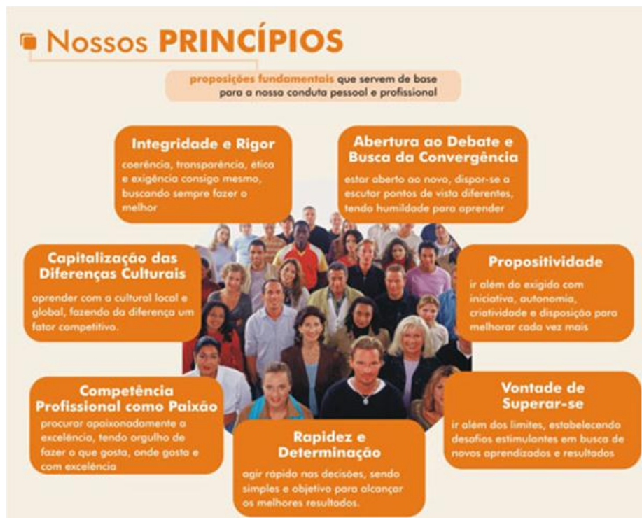
Imagem 10: Princípios