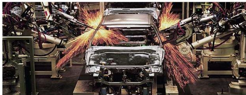
Imagem 4: Produção

Pólo de Desenvolvimento: o Pólo de Desenvolvimento Fiat é composto de seis áreas de engenharia e capacita a Fiat Automóveis a possuir toda a tecnologia de projetar um automóvel, desde o design até a construção dos protótipos. O Centro Estilo é a única área de concepção de design da Fiat fora da Europa. As áreas são: Engenharia Elétrica e Eletrônica, Engenharia Carroceria, Engenharia Chassi, Construção de Protótipos e por fim, Engenharia de Experimentação de Veículos, que é a área responsável pela avaliação final do produto.