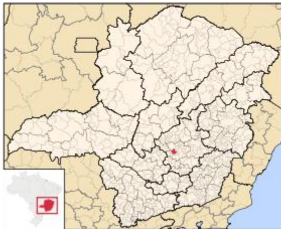
Imagem 1: localização da cidade de Betim/MG

Localização: A empresa está localizada em Betim/MG, um município na região metropolitana de Belo Horizonte e a 5ª maior cidade do estado, com uma população total de 375.331 habitantes (2010). A ida da Fiat para a cidade, na década de 70, causou grande impulso econômico e a industrialização da mesma mudou seu caráter interiorano, multiplicando sua população e diversificando sua cultura.