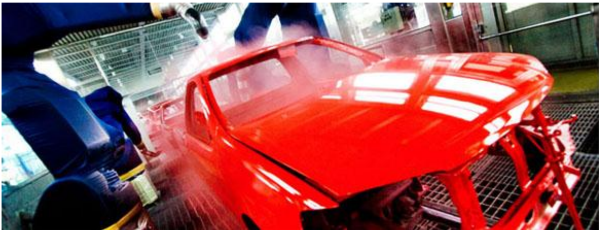
Imagem 6: Pintura

Pintura: O processo de pintura é o que mantém a beleza da carroceria de um automóvel. Para isso, seu processo de tratamento é usado para proteção contra corrosão e resistência a intempéries, cujos materiais resultam na cobertura das chapas internas e, externamente, na formação de película de cor final, síntese da excelência de proteção e aparência do produto.