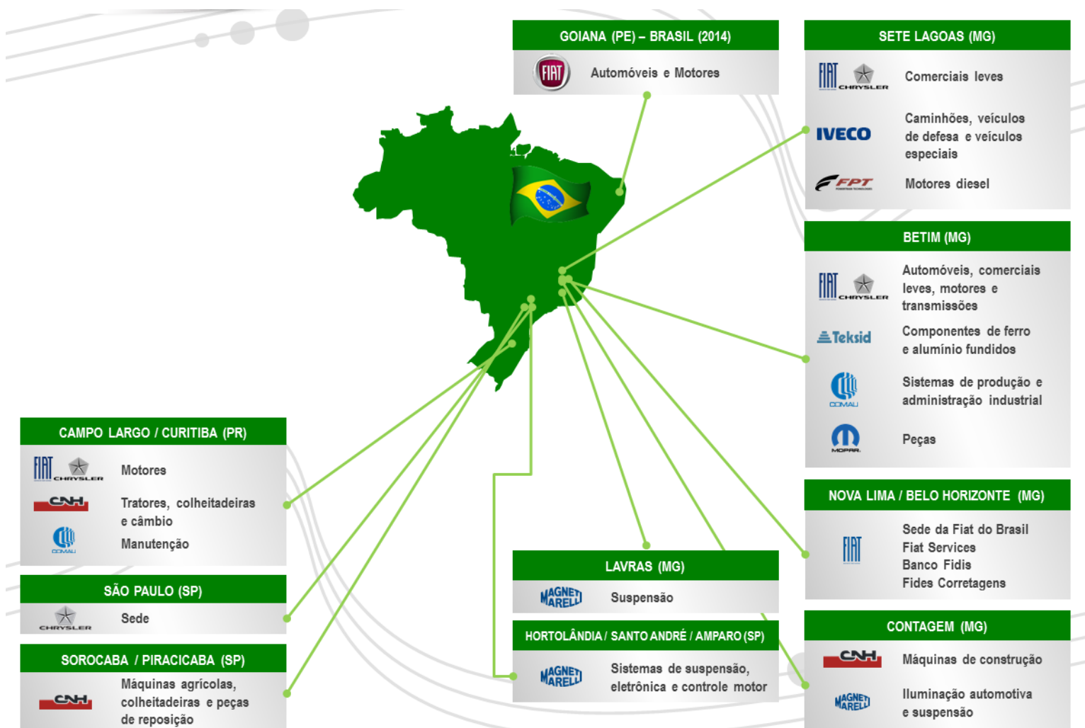
Imagem 3: Grupo Fiat no Brasil

Tais informações podem ser visualizadas na figura abaixo: