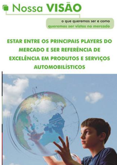
Imagem 9: Visão