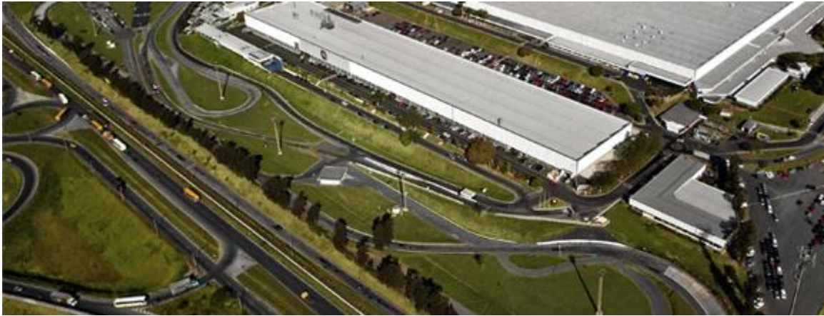
Imagem 7: Pista de testes

Pista de testes: Para garantir a segurança e a qualidade dos veículos Fiat, 100% dos carros que saem da linha montagem passam pela pista de testes. São quase 4 quilômetros de pista, onde são efetuados diferentes tipos de avaliação: testes de rumorosidade: aqui os veículos são submetidos a diferentes tipos de piso; testes de impermeabilidade: feitos na cabine hídrica; testes de câmbio e transmissão: todas as trocas de marchas são testadas em condições adversas; testes de frenagem: também realizado em diversas situações.