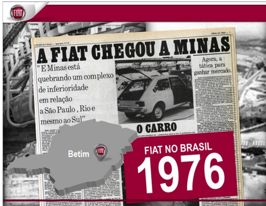
Imagem 2: chegada da Fiat no Brasil

Durante o ano de 2014 será inaugurada a nova fábrica da Fiat no Brasil, em Goiana, estado de Pernambuco, onde serão produzidos até 250 mil automóveis por ano.